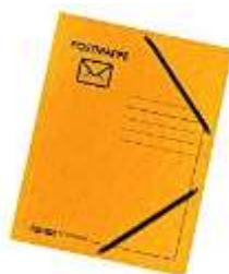
1 gelbe Postmappe